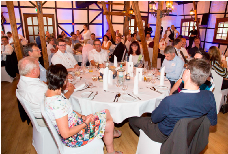
Foto: Feier im Golfhotel

In familiärer Atmosphäre feierte die VPF mit Kunden und Geschäftspartnern bis in den späten Abend hinein. Geboten wurde ein abwechslungsreiches Unterhaltungsprogramm.