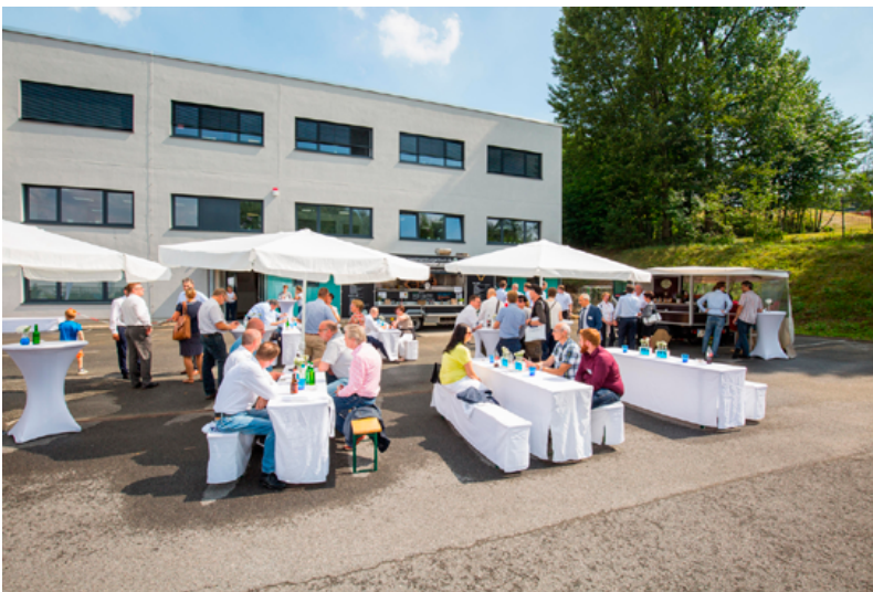
Motiv: Gebäude während des Tag der offenen Tür Mehr als 120 Gäste kamen zum Tag der offenen Tür bei der VPF. Anlass war das 50 jährige Firmenjubiläum des Unternehmens mit der Einweihung des neuen Hauptgebäudes am Firmensitz Sprockhövel. Es erhielt eine zusätzliche Etage, um Labore und Verwaltung unter einem Dach zu vereinigen.